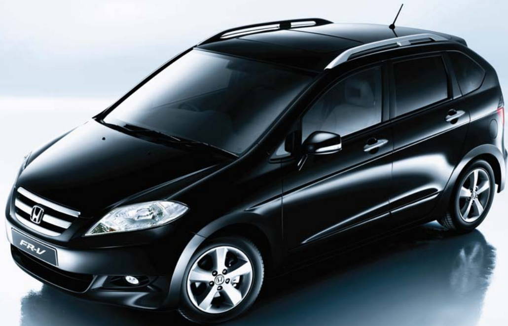
Nighthawk Black Pearl